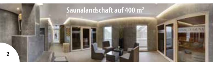
Saunalandschaft auf 400 m 2