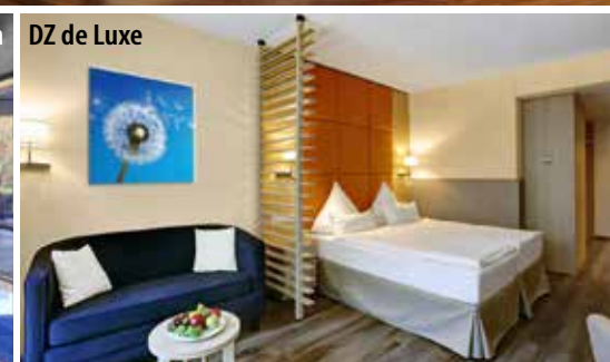
DZ de Luxe

Das 4-Sterne-Parkhotel CUP VITALIS begeistert seine Gäste mit seinem einladenden Ambiente, der traumhaften Aussicht auf Bad Kissingen und die umliegenden Wälder, seinem großen SPA und Sportbereich sowie der weitläufigen Parkanlage, die es umgibt.