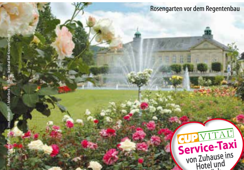
Rosengarten vor dem Regentenbau

CUP VITAL Service-Taxi von Zuhause ins Hotel und zurück