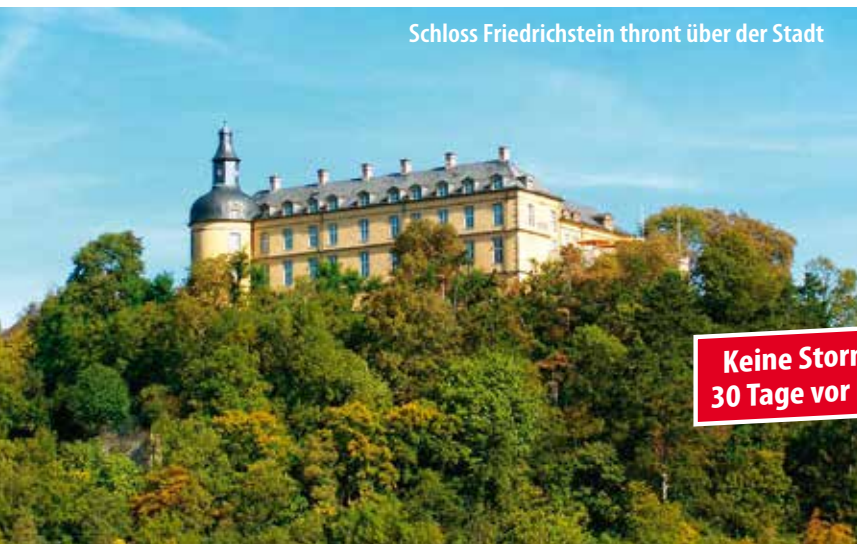
Schloss Friedrichstein thront über der Stadt