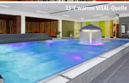
33°C warme VITAL-Quelle